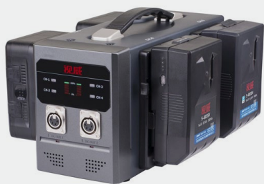
可同时对4块V字型电池进行独立充电， 每路充电输出为DC 16.8V, 3A。