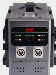
SC-3430V/G各通道均设有LED充电指示灯 分别显示四路电池的充电状态。