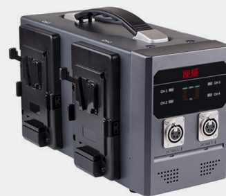
AC-DC适配输出 支持2路四芯卡侬适配同时输出